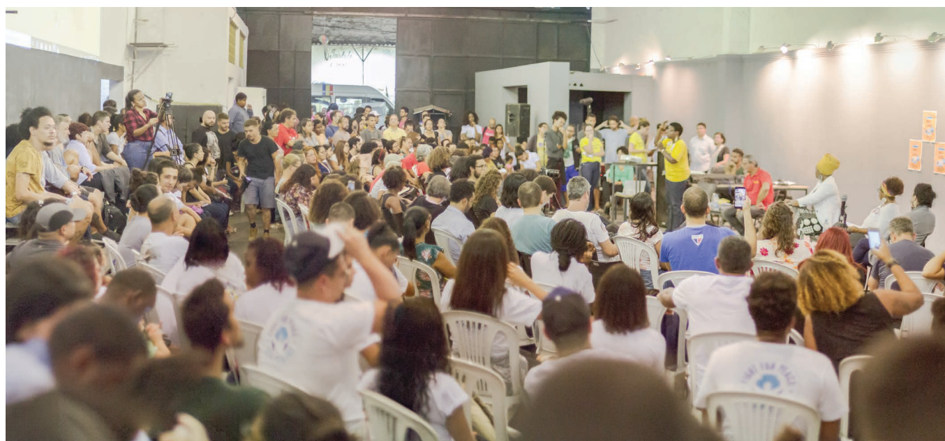
Promovido pelo Fórum, debate reúne candidatas ao governo do estado do Rio de Janeiro em setembro de 2018, no Centro de Artes da Maré

Os encontros do Fórum têm como objetivo gerar discussão e construir caminhos e espaços coletivos de escuta, acolhimento e formulação de propostas