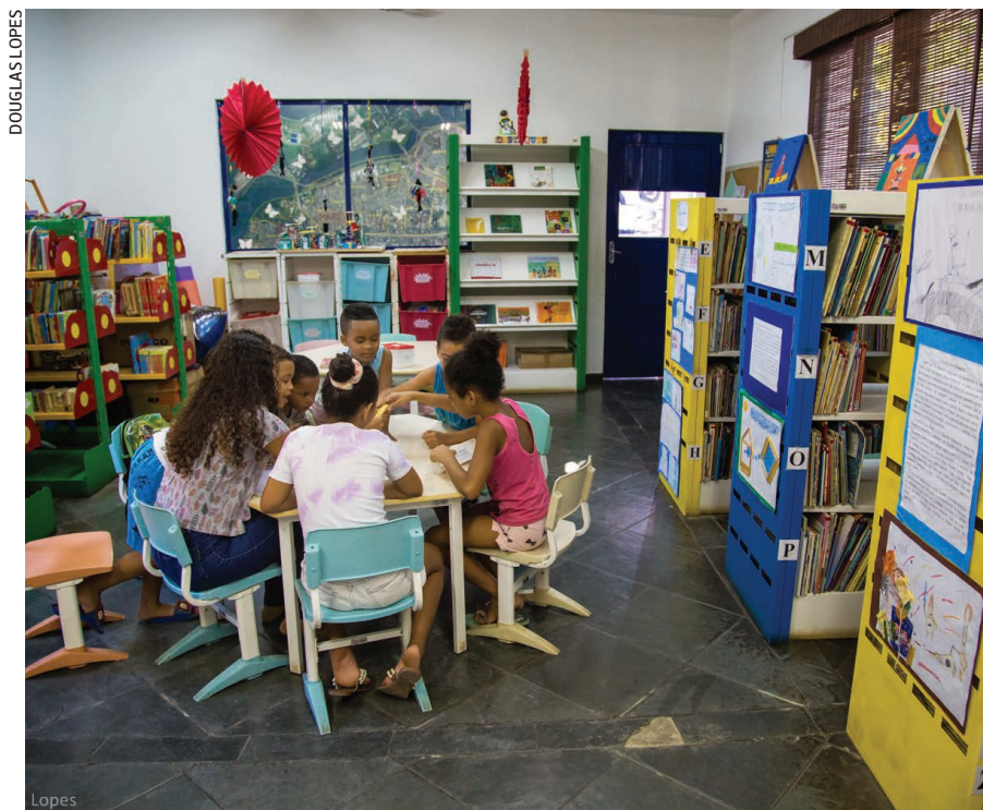
Sala de Leitura Maria Clara Machado: desenvolvendo o hábito de ler nos pequenos