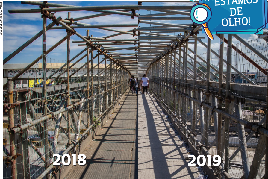
Passarela 10: piso, que era de madeira e borracha, ganhou uma camada de cimento; fiação elétrica ainda apresenta riscos