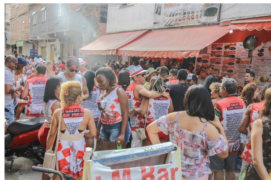
Feijoada e samba: devoção alia rituais religiosos, manifestações culturais e festas populares

O fato é que, independentemente da crença que se cultiva, é essencial respeitar a “imensa legião de Jorge”, que celebra sua fé em um dia no qual as diferenças são diminuídas e os mesmos espaços compartilhados por pessoas de religiões diferentes, cultivando cada um, à sua maneira, a sua divindade e pedindo força e proteção para os dias difíceis. Salve Jorge, Ogunhê!