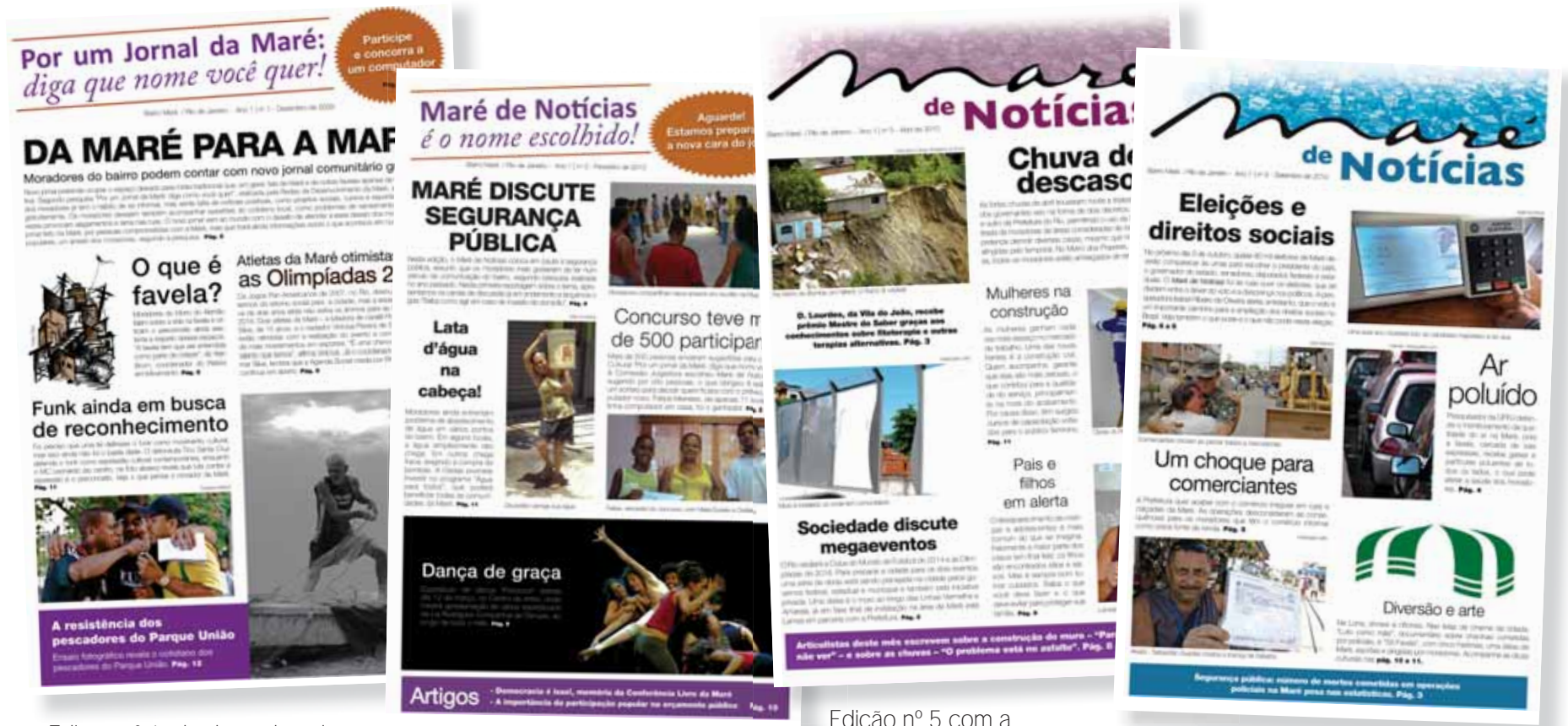
Edição nº 1, de dezembro de 2009: jornal ainda sem nome