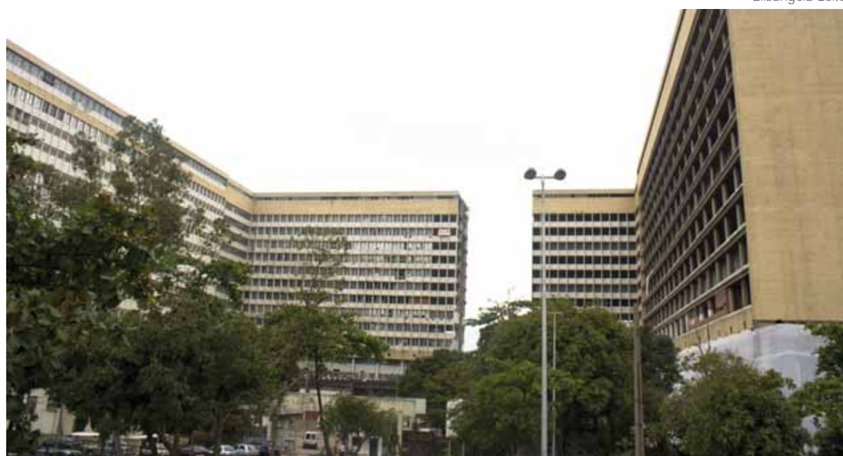
A ala sul, que nunca foi usada, ficava ligada à outra parte do HU