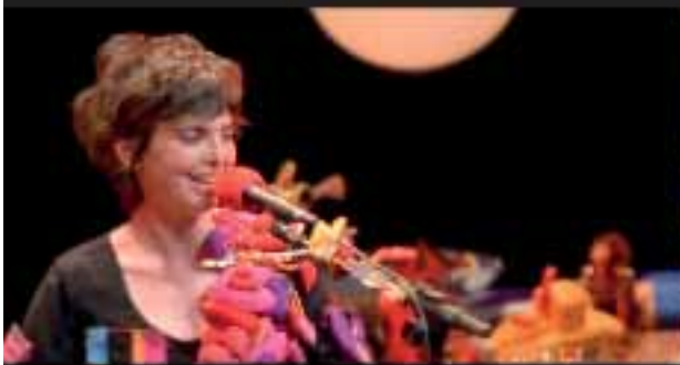
Adriana Partimpim Dois é Show Dia 24/12, às 20h30

Na véspera de Natal, crianças e pais poderão se divertir juntos com a exibição do espetáculo 'Adriana Partimpim dois é Show'. E, para fechar a noite, o telespectador terá uma dose de música cubana com o premiado documentário 'Buena Vista Social Club', de Wim Wenders. Na noite de réveillon, Bia Corrêa do Lago vai comandar um bate-papo recheado de humor com a turma do Casseta & Planeta no programa 'Umas Palavras'.