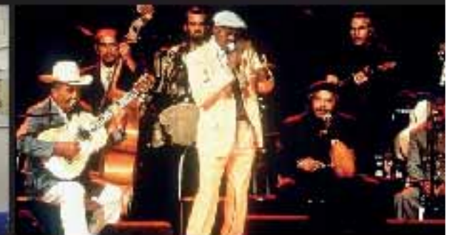
Cine Conhecimento: Buena Vista Social Club Dia 24/12, às 22h