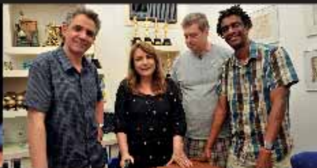
Umas Palavras Especial – Casseta & Planeta Dia 31/12, às 21h