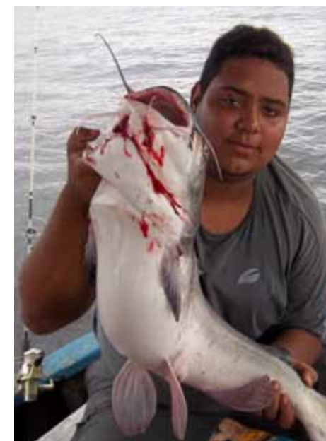
Arquivo / Colônia Parque União