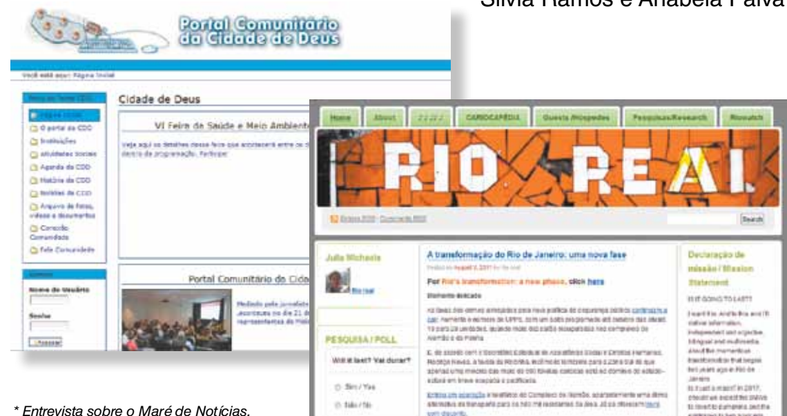
* Entrevista sobre o Maré de Notícias.