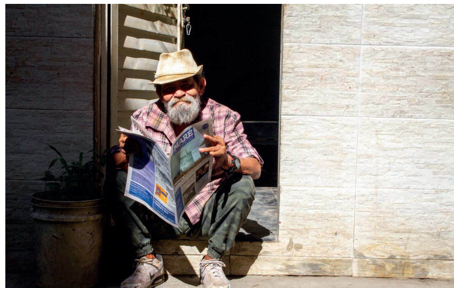
São 150 edições na luta para gerar fortalecimento de memórias e identidades

Em 2022, publicamos a série de reportagens Raio-