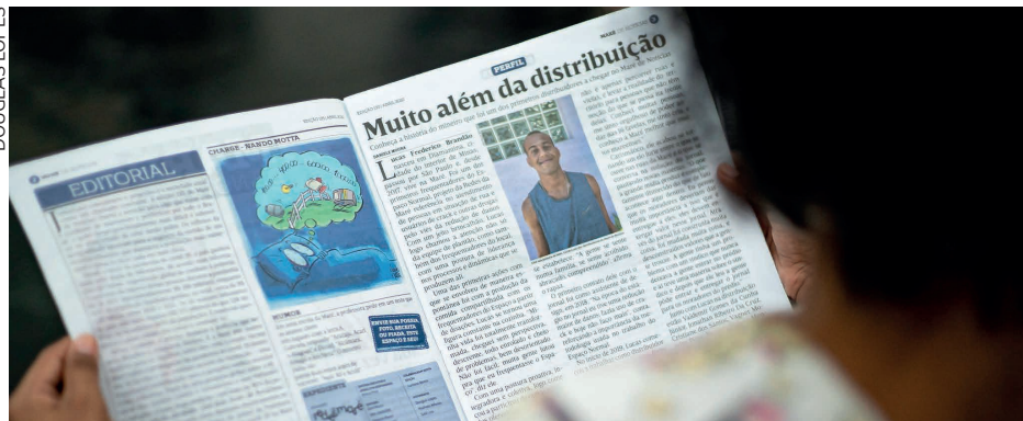
A atenção dos jornalistas é voltada para como a Maré pode e deve ser representada