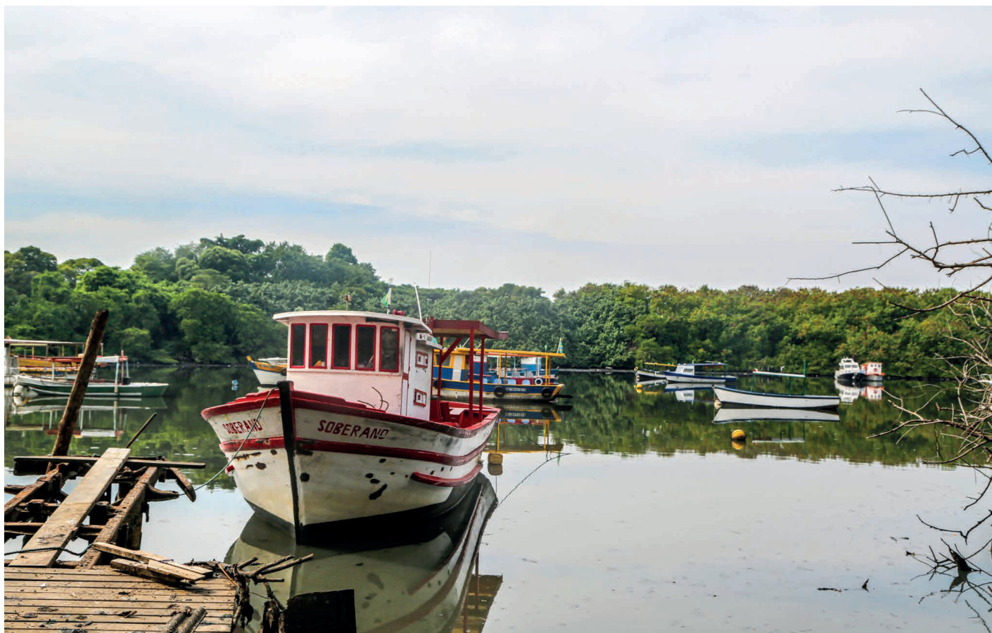
Pescadores sofrem com a poluição, que atinge redes e hélices dos barcos. Hoje resistem apenas quatro colônias na Maré