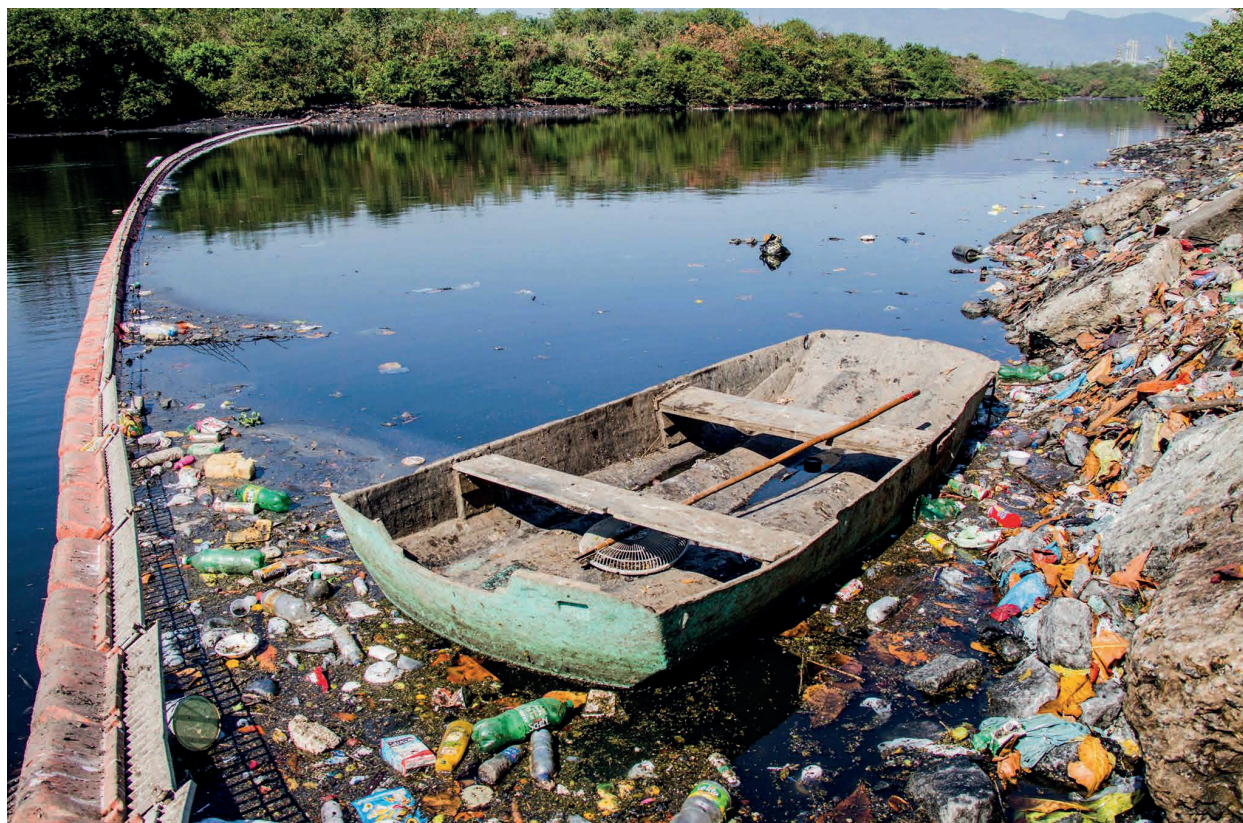
Legado que não vingou: Jogos Olímpicos do Rio prometiam a despoluição da Baía de Guanabara, mas projeto não foi à frente