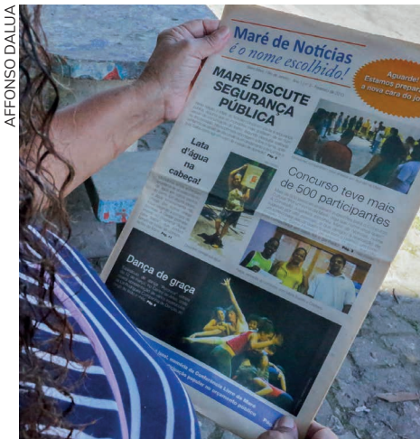
A 3ª edição anunciou os vencedores do concurso

Coube a uma comissão julgadora com cinco membros escolher entre os mais de 500 nomes enviados. Entre os participantes, esta-