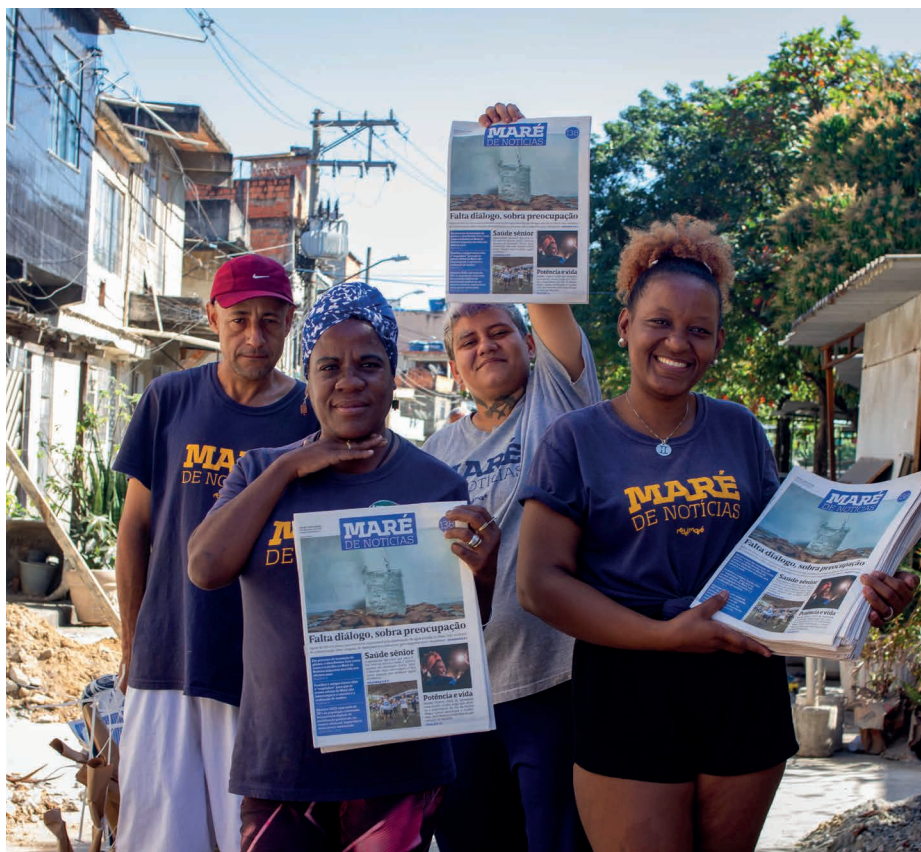
Mobilização envolve parceiros e moradores na produção e distribuição das notícias

muitas histórias foram contadas e transformações foram percebidas no território. Nesta matéria, contaremos algumas delas.