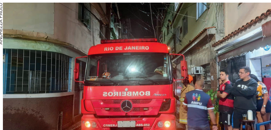
Mesmo com o Corpo de Bombeiros presente, moradores acabam por ajudar no combate às chamas

elétrica disse que “assim que acionada sobre a ocorrência, a Light envia equipe ao local para verificar as condições e restabelecer a energia o mais brevemente possível”. Segundo a concessionária, os incêndios são causados pelas ligações elétricas clandestinas, e diz que “atua, diariamente, em parceria com o poder público para coibir o furto de energia”.