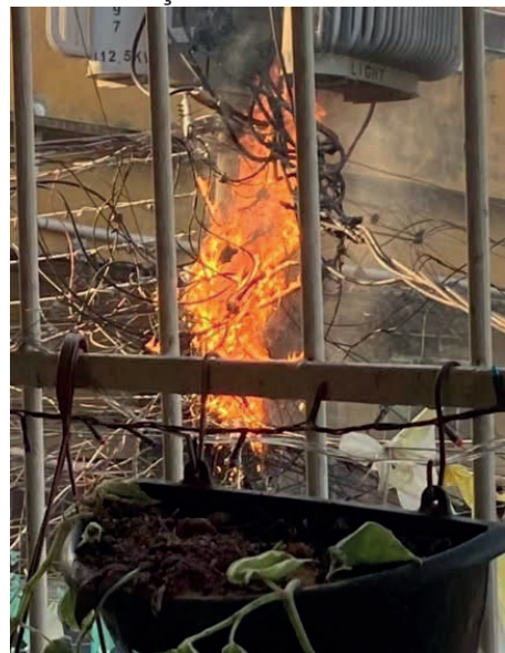
Incêndio em poste levou pânico aos moradores

O incidente comoveu os moradores vizinhos, que se mobilizaram em uma corrente de solidariedade em prol da família. Alimentos, móveis e utensílios foram doados, e agora os esforços da comunidade são pela reconstrução da casa.