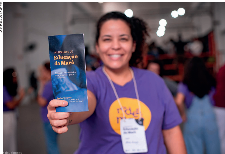
4º Seminário de Educação da Maré aconteceu em junho e contou com mais de 300 participantes das discussões e reflexões da Redes da Maré com os dirigentes das associações de moradores que, naquele momento, já se reuniam há quase um ano para discutir uma proposta conjunta de um projeto estrutural para a região.

Em 2001, existiam apenas 19 escolas públicas no território: 16 da rede municipal e 3 da rede estadual. Hoje, elas são mais do que o dobro, comprovando que o trabalho de mobilização territorial é efetivo e inspirador. Em 2012, o coletivo A Maré que Queremos entregou, para o então prefeito Eduardo Paes, um documento que sistematizava os resultados