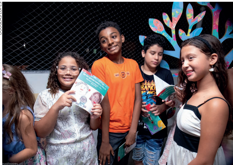
Nos livros, os escritores mirins expressaram preocupações durante a pandemia e outros temas