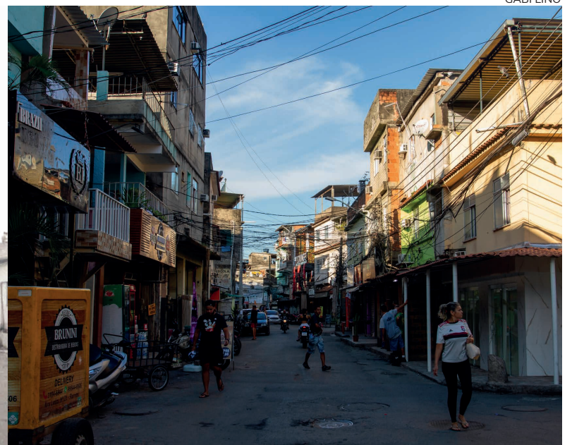
Antes e depois da Rua Ary Leão, uma das mais movimentadas do Parque União. Favela é a mais populosa da Maré, com mais de 20 mil moradores