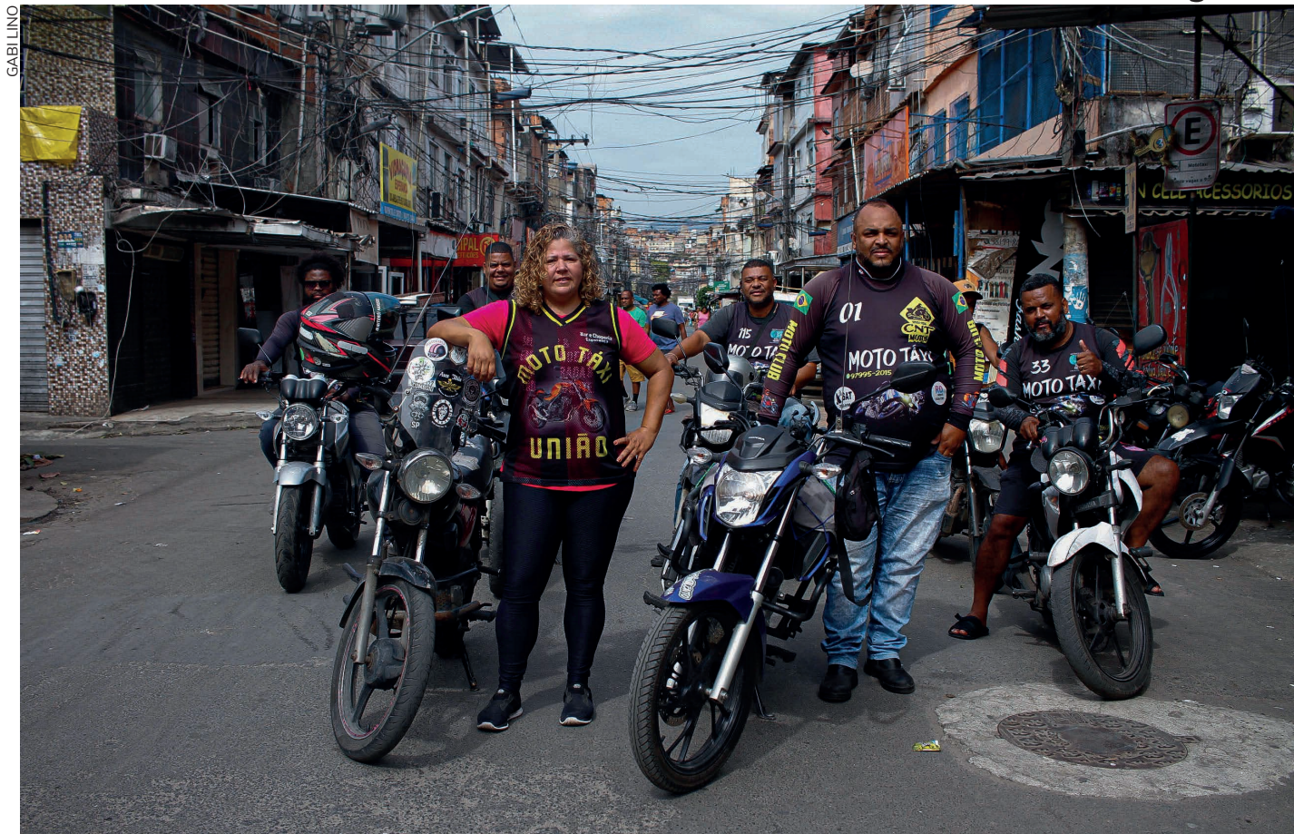
Segundo o Ipea, o Brasil tem mais de 1,5 milhão de motoboys e mototaxistas, em maioria homens negros com menos de 50 anos

Ele trabalha há cinco anos como mototaxista, cinco dias por semana, e enfrenta tanto a desvalorização como os perigos do trabalho: “Não sei se vou estar vivo amanhã por conta dos acidentes. Já passei por muitos e mesmo assim sinto medo.”